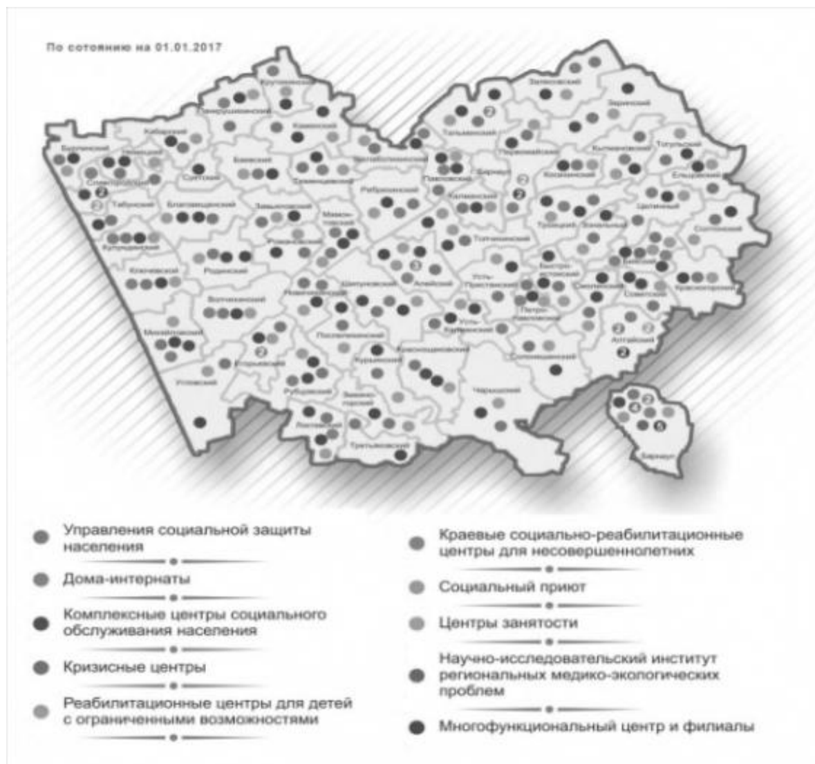
Рисунок 2 - Карта территориальных управлений и подведомственных учреждений Минтрудсоцзащиты

Расположение территориальных управлений и подведомственных учреждений социальной сферы края представлено на рисунке 2. Согласно карте, в большинстве районов края представлены управления по социальной защите, центры занятости и многофункциональные центры и филиалы. Социальный приют в Алтайском крае один, так же, как и научно-исследовательский институт региональных медико-экологических проблем.