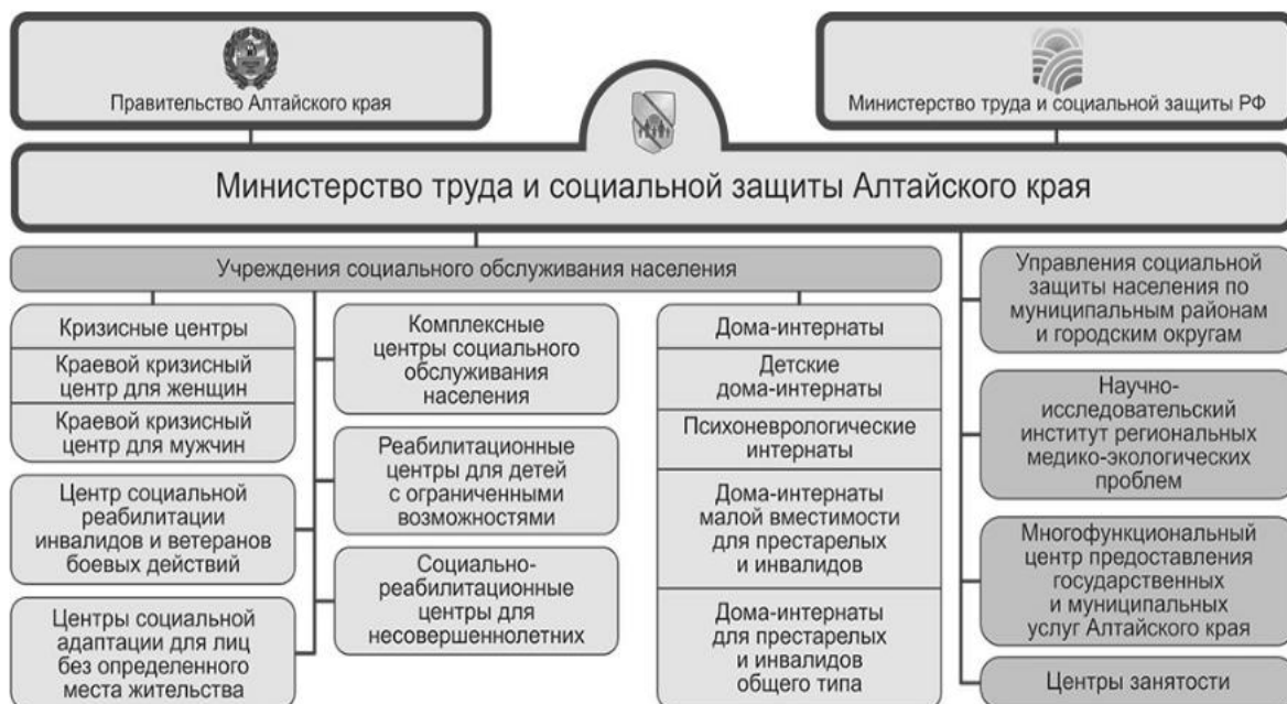
Рисунок 1 - Структура системы труда и социальной защиты в Алтайском крае, с 2017 г.

В целях обеспечения функций в указанных сферах действует система территориальных управлений и подведомственных учреждений. В настоящее время структура социальной сферы в Алтайском крае (рис.1) включает: