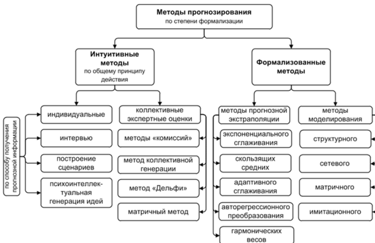
Рисунок 2. Виды методов политического прогнозирования по степени формализации

Как видно из представленной схемы, по степени формализации методы политического прогнозирования имеют подразделение на формализованные и интуитивные.