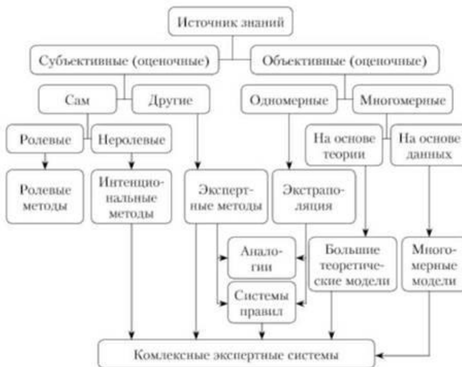
Рисунок 4. Дерево прогностических методов

Отметим, что противопоставлять рассмотренные классификации методов друг другу не имеет смысла, поскольку одни и те же методы могут структурно входить в зависимости от выбираемого основания классификации в различные системы.